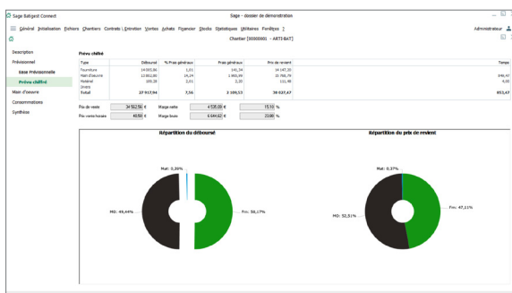
Interface chantier simplifié